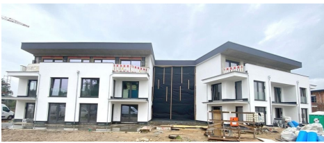
Süd-West Stand 10/2023