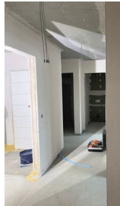
Beispiel Flur/Bad Stand 10/2023