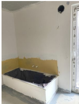
Beispiel Bad Stand 10/2023