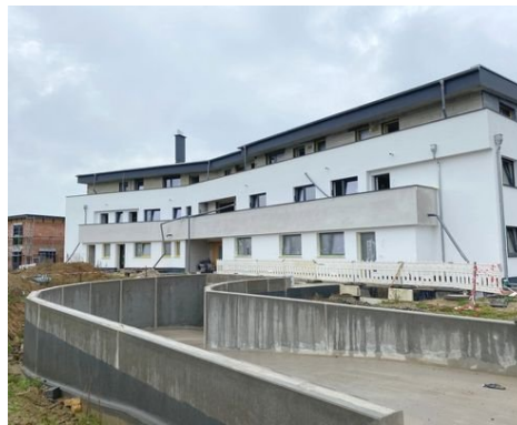
Hauseingangsseite Stand 10/2023