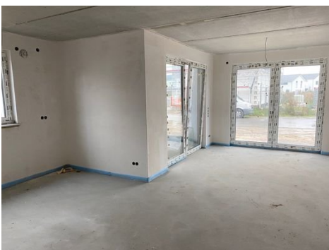
Beispiel Wohn-/Esszimmer Stand 10/2023