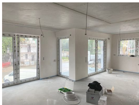
Beispiel Wohnküche/Esszimmer Stand 10/2023