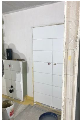
Beispiel Bad Stand 10/2023